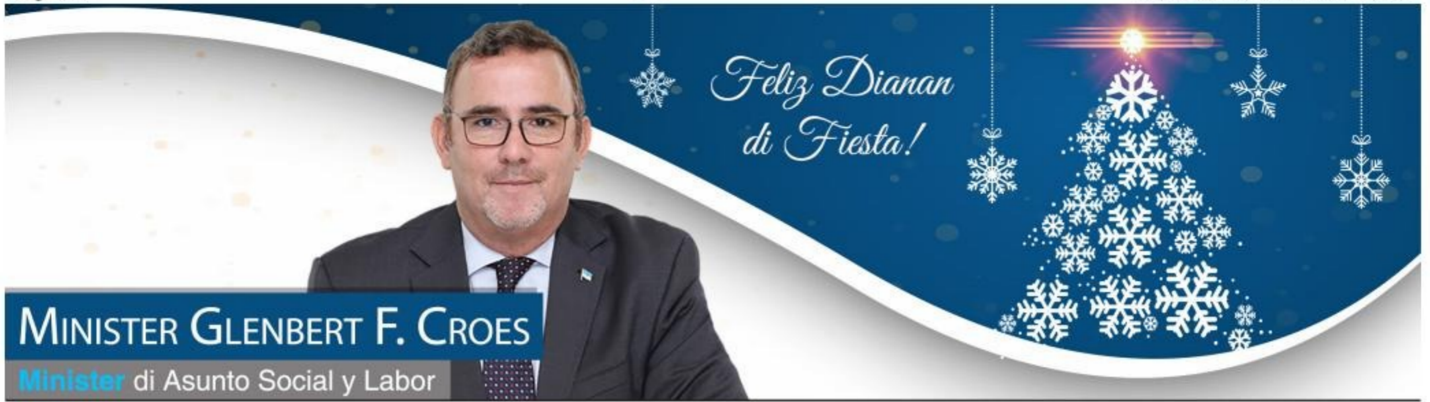
MINISTER GLENBERT F. CROES Minister di Asunto Social y Labor